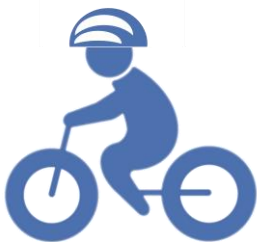
ヘルメットをかぶろう